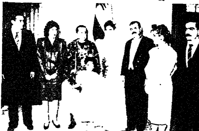
ضابط وعروسه توجهوا على رأس وفد الى بعيدا (بشارة الشايب)